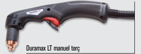
Duramax LT manuel torç