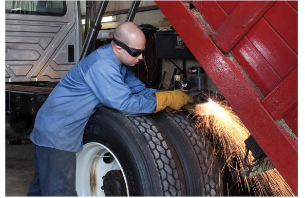
Taşıt tamirati ve modifikasyonu