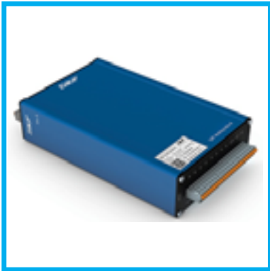
SKF Online İzleme Sistemleri