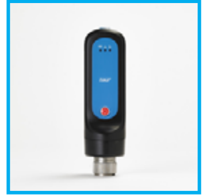
SKF Quick Collect Sensör

Size en uygun sistem için bizimle irtibata geçebilirsiniz: teknik@unluteknik.com