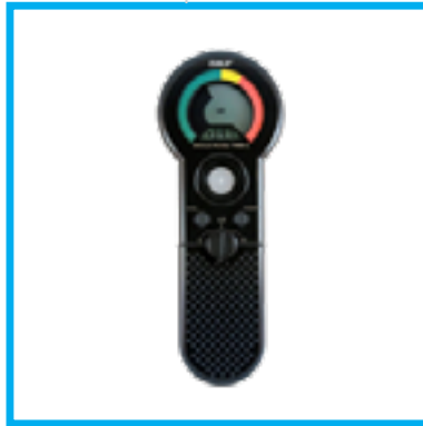
SKF Portatif Yağ Analiz Kitleri